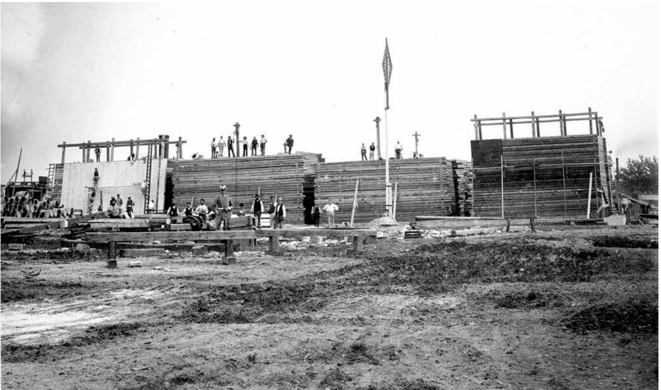
1891. I Tuborg Havn er en række tømmerkister til bølgebryderen på Middelgrundsfort ved at blive færdigbygget. Tømmerkisterne blev, når de var søsat, bugseret ud til byggepladsen og sænket ved opfyldning med sand og sten, hvorefter de udgjorde fundament for den ca. 1,2 m tykke betonplade og granitstensmur, som blev lagt og bygget oven på kisterne. Toppen af kisterne kom til at ligge ca. en meter under dagligt vande. Bemærk, at kisten til venstre er ved at blive beklædt med en ydervæg af planker, der skulle sikre, at sandet ikke blev vasket ud af kisten af søgangen.